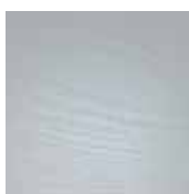
PENSELMÅLAD ACCOYA FSC®

ALLMÄNT Allt görs hos oss i Bovallstrand, från sågat virke till färdig produkt. Inga karmar, paneler eller lister köps in av underleverantörer. Allt för att ha kontroll på kvalitén.